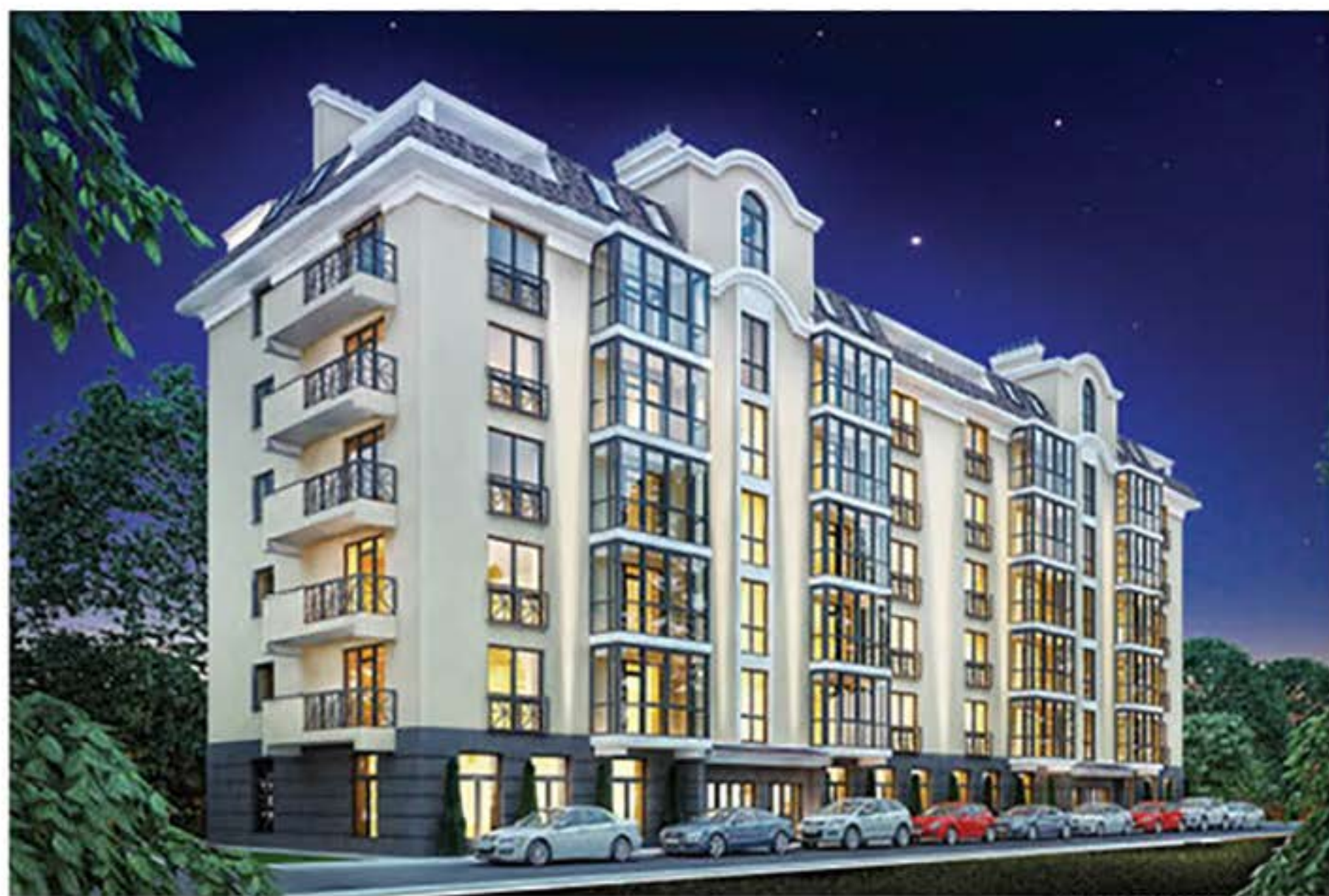
ЖК «ALMOND APARTMENTS»

Удобство обслуживания, идеальная чистота и порядок жилого комплекса являются неотъемлемыми атрибутами ЖК «Urban Ranch». Жители комплекса получают высокий уровень сервиса коммунального и бытового обслуживания.