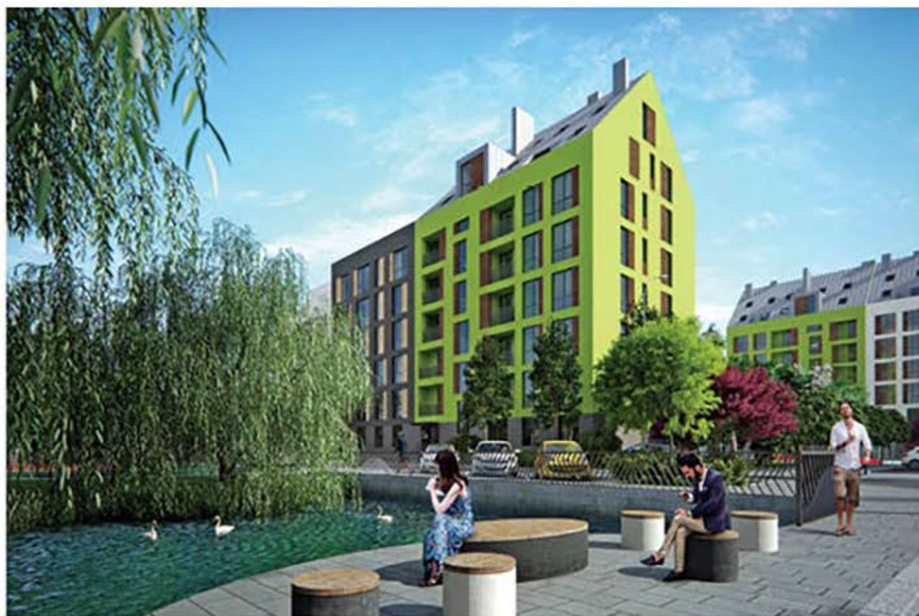
Вид на озеро «URBAN RANCH»