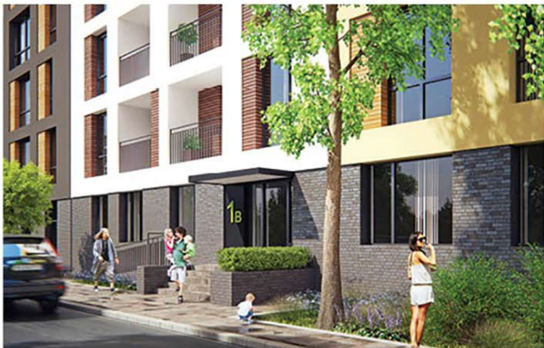
Вид на подъезд «URBAN RANCH»