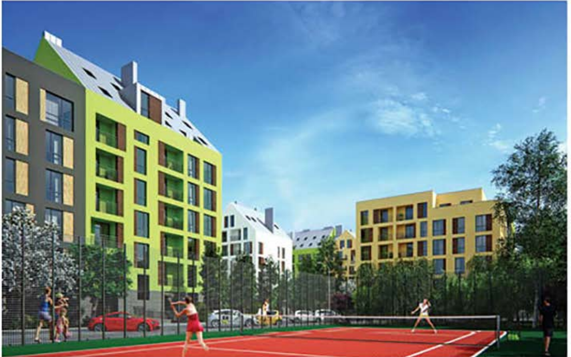
Корты на территории комплекса «URBAN RANCH»

Проанализировав потребности людей, проживающих в современных мегаполисах, проект «Urban Ranch» предлагает будущим жильцам широкий спектр услуг: