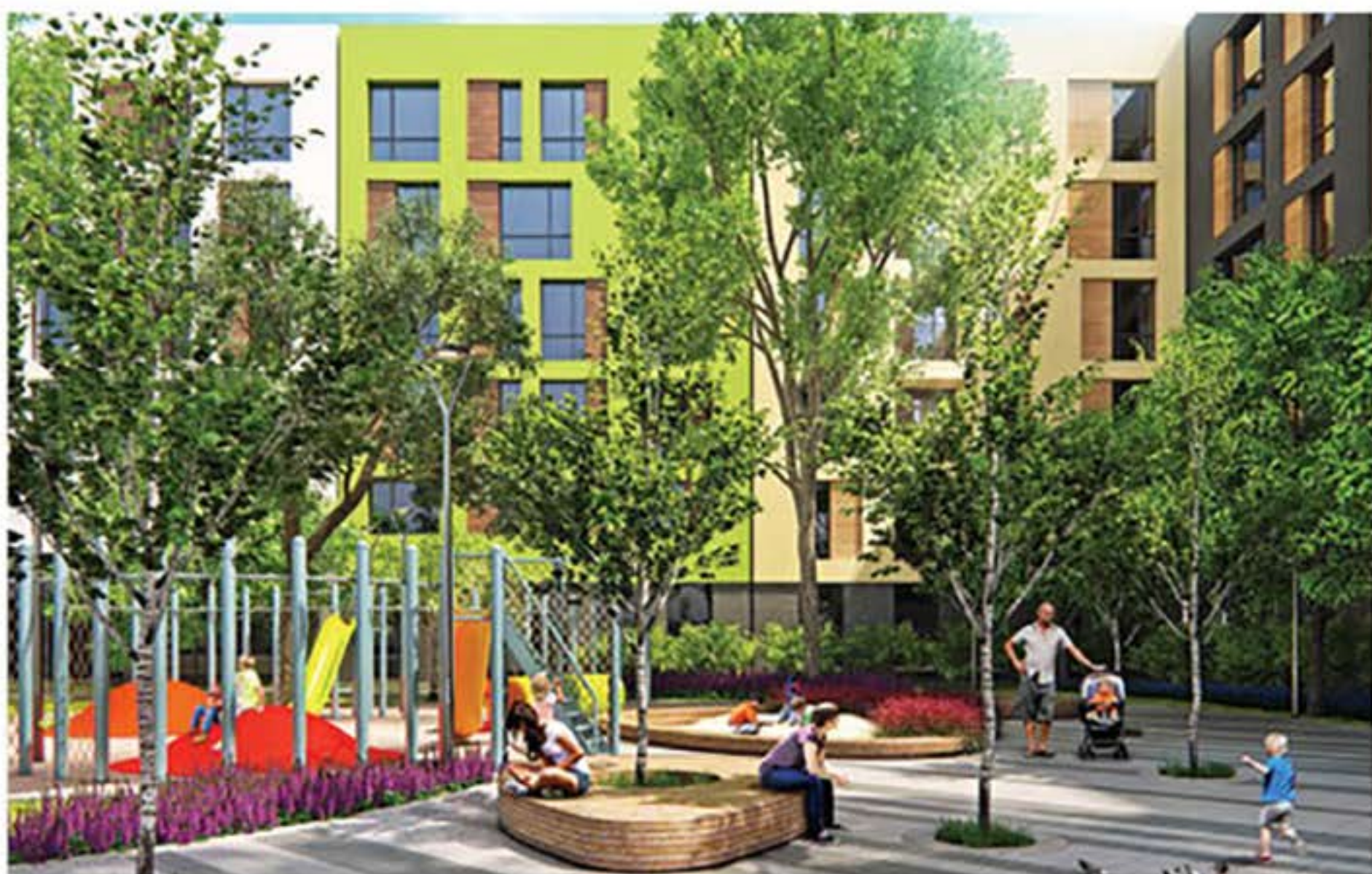
Вид на дворик «URBAN RANCH»