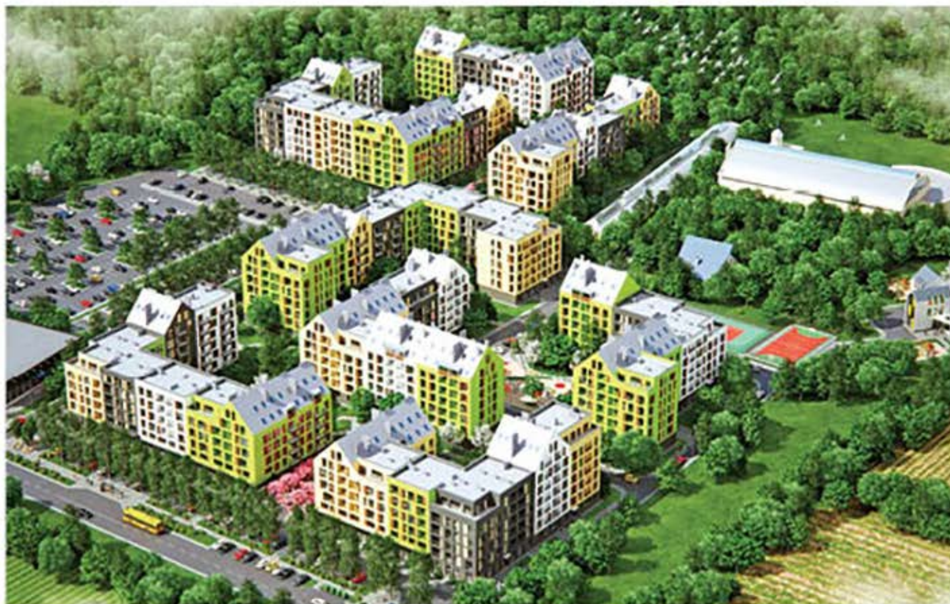
Вид на жилой комплекс «URBAN RANCH»